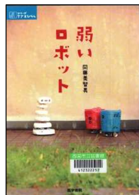
『弱いロボット (シリーズクアをひらく)』