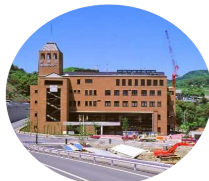
建設中の塩瀬センター