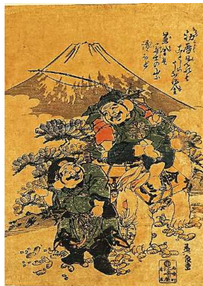
新年を寿ぐ【恵比寿大黒天図】

江戸時代後期の錦絵。七福神の中でも「えびす・だいこく」 は特に庶民の人気を集め、よく一緒にまつられました。 めでたい絵柄で埋め尽くされています。