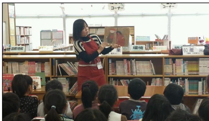
☐ 2年生に向けて「日本の昔ばなし」ブックトーク