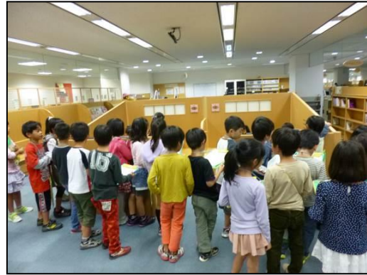
☐☐図書館見学の様子