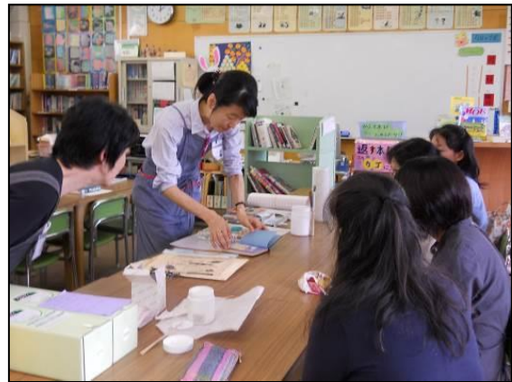
☐☐図書ボランティアへの修理講習