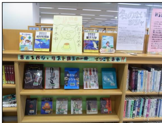
☐ 中学図書委員のおすすめの本の展示コーナー