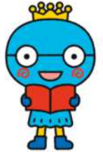
西宮市キャラクター みやたん

中央・北口図書館に、西宮の「ひと・もの・こと」を紹介するコーナーを作成しました。これからさらに情報を集めて紹介していきますので、ぜひご利用ください。