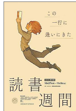
2024・第78回読書週間ポスター

終戦の2年後の1947年に「読書の力によって、平和な文化国家を創ろう」という決意のもと、第1回「読書週間」が開催されました。各地で講演会・図書に関する展示会が開かれ、その反響は大きなものでした。「一週間では惜しい」との声を受け、第2回以降は10月27日から11月9日（文化の日をはさんで2週間）となりました。