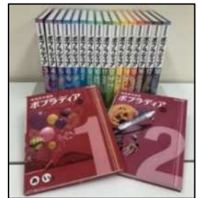
「総合百科事典ポブラディア」 ポブラ社 03